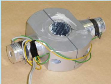
▲ 超音波振動装置の一部