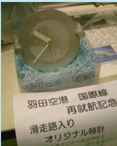
▲ 羽田国際線就航記念時計